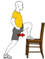
ESTIRAMIENTO FLEXORES CON APOYO