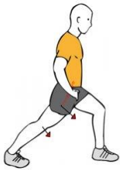
ESTIRAMIENTO FLEXORES DE PIE