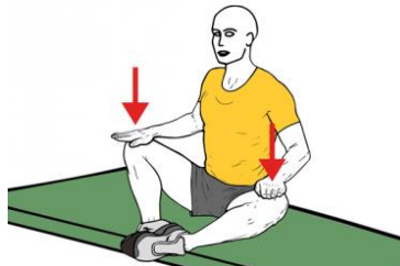
ESTIRAMIENTO ADUCTORES AUTOASISTIDO