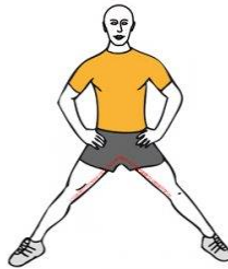
ESTIRAMIENTO ADUCTORES BILATERAL