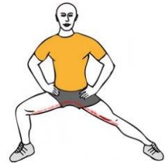
ESTIRAMIENTO ADUCTORES UNA PIERNA