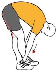
ESTIRAMIENTO EXTENSORES DE PIE