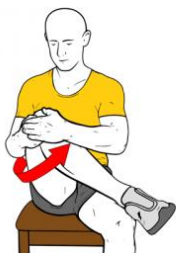
ESTIRAMIENTO ROTADORES SENTADO