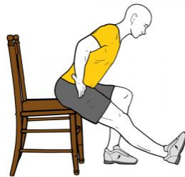
ESTIRAMIENTO EXTENSORES SENTADO