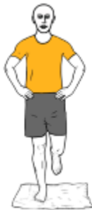
EQUILIBRIO A UNA PIERNA SOBRE ALMOHADA