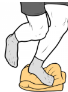
EQUILIBRIO A UNA PIERNA SOBRE TOALLA