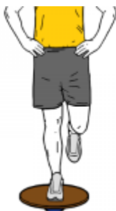
EQUILIBRIO A UNA PIERNA SOBRE TABLA DE EQUILIBRIO