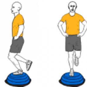
EQUILIBRIO A UNA PIERNA SOBRE BOSU