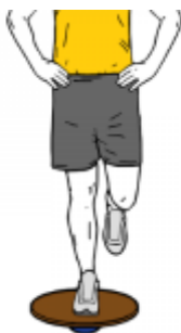
EQUILIBRIO A UNA PIERNA SOBRE TABLA DE EQUILIBRIO